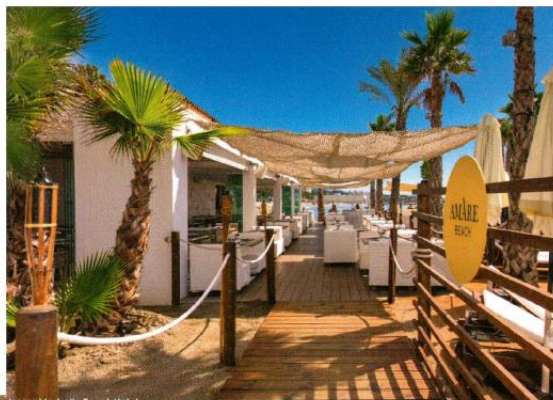
Amare Marbella Beach Hotel