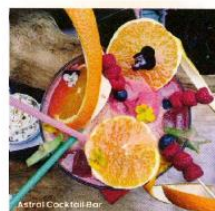
Astral Cocktail Bar